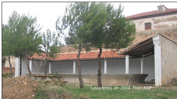
Lavaderos, en 2004.

Las aguas, que al decir de los vecinos tienen virtudes contra la obesidad, y en verdad que no hemos visto gentes muy rollizas por aquí, se captan a cosa de medio kilómetro y desembocan en la plaza, en dos hermosos caños , de una fuente cubierta. Las obras han costado unas