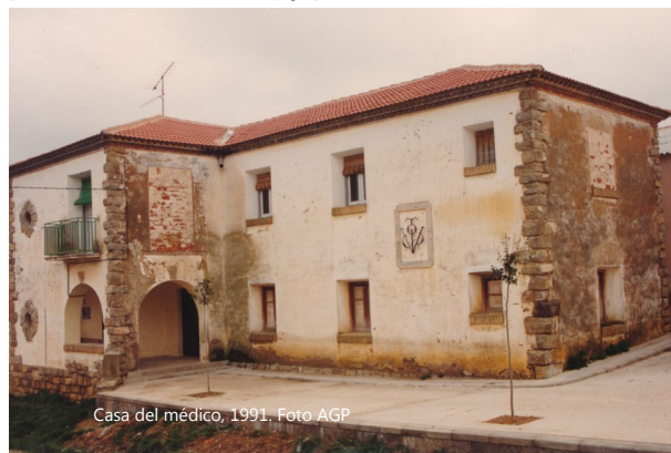
Casa del médico, 1991.

EN NOGUERAS. Desde Piedrahita, la comitiva se fue a Nogueras, (inauguraron un lavadero y un puente, entre otras) y posteriormente a Loscos.